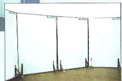
Lärmschutzwand aus 4 Elementen, fahrbar