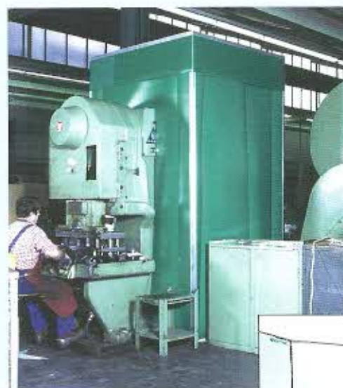
Maschinenkapselung mit Optiduuu Lärmschutzfolie